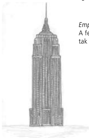
Empire State Building (New York, 1931)

A felhőkarcoló 102 emeletes, építésénél 10 millió téglát használtak fel. A gazdasági fellendülés szimbólumának szánták.