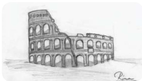
Colosseum (Róma, i.e..80)

A felhőkarcoló 102 emeletes, építésénél 10 millió téglát használtak fel. A gazdasági fellendülés szimbólumának szánták.