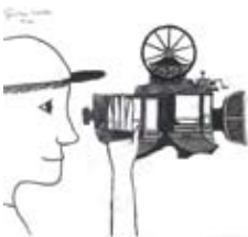
Garai Luca (7.a)