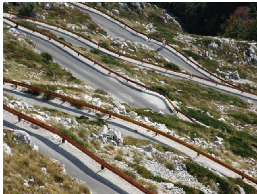
Szerpentin egy horvátországi nemzeti parkban