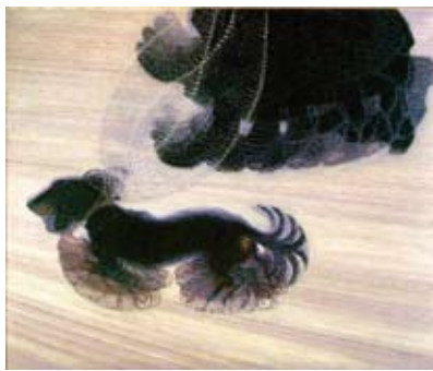
Giacomo Balla: Pórázon vezetett kutyá