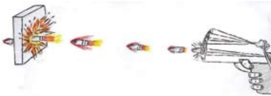
Bosznai Emil (9.d)