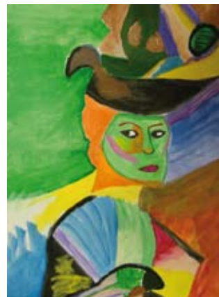
Szántó Petra (10.a)