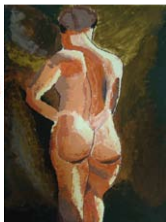
Slemmer Ádám (10.c)