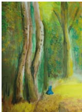
Huber Dávid (10.c)