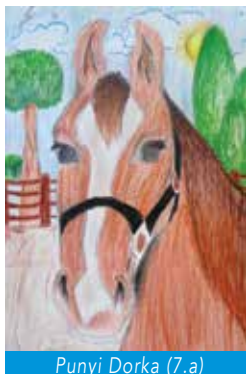
Punyi Dorka (7.a)