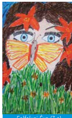
Felfalusi Éva (7.a)