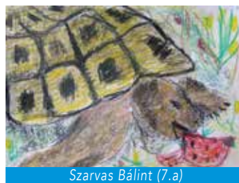
Szarvas Bálint (7.a)