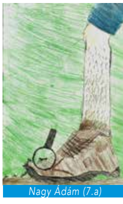
Nagy Ádám (7.a)