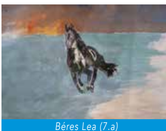
Béres Lea (7.a)