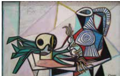
Pablo Picasso: Csendélet koponyával, kancsóval és póréhagymával (1945)