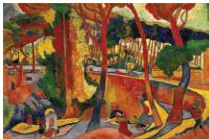
Andre Derain: Útkanyar (1906)