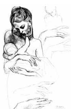
Pablo Picasso: Anya gyermekével