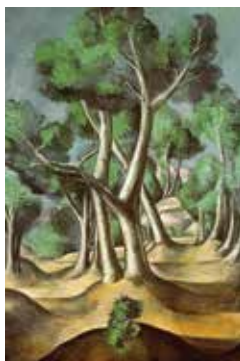
Andre Derain: Liget (1912)