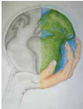
Bencze Zsófia (9.c)