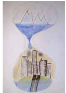
Tóth Ádám (9.d)