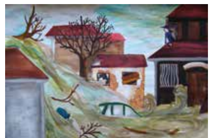
Szentágotay Noémi (8.c)