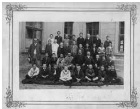
Az első fennmaradt tabló 1905-ből

– Amikor visszakaptuk az épületet a Kandó Kálmán Főiskolától, lehetőség nyílt egy tágas, modern, jól felszerelt könyvtár kialakítására. Úgy gondoltuk mi, könyvtáros tanárok, hogy a hagyományos könyvtári munka mellett igyekszünk egyfajta „tudásközpontot”, kulturális centrumot létrehozni. Ekkor kezdtünk komolyan foglalkozni az iskolatörténettel, az ehhez kapcsolódó dokumentumok összegyűjtésével. Sok dokumentum megmaradt a régi időkől, amelyek érdemesek arra, hogy megmentsük őket.