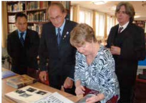
Sárközy Pál árpados öregdiáknak, az akkori francia köztársasági elnök (Nicolas Sarkozy) édesapjának látogatása az iskolában 2009-ben

– Néhány évvel ezelőtt csináltunk egy kiállítászt az öregdiák-találkozóra. Nagy sikere volt. Azóta nagyon sok régi, kedves iskolai emléket hoztak be a múzeum számára a régi árpadosok. Ezeket úgynevezett csomagokban őrizzük. Ilyen, konkrét személyhez köthető „csomag” jelenleg kb. 20 van. Köztük a Sinkovits-csomag a legkedvesebb számomra. És hogy arra is feleljek, hogy szeretem-e ezt csinálni, az a válaszom, hogy igen. Nagyon szeretem ezt az iskolát, nem véletlen, hogy már 40 éve itt vagyok. Hálás vagyok az igazgató úrnak, a sorsnak, hogy ilyen szép munkával fejezhetem be a pályámat. De azért teljesen nem szakadok el az iskolától. Hetenként egyszer, kedden még bejövök egy kicsit dolgoztatni