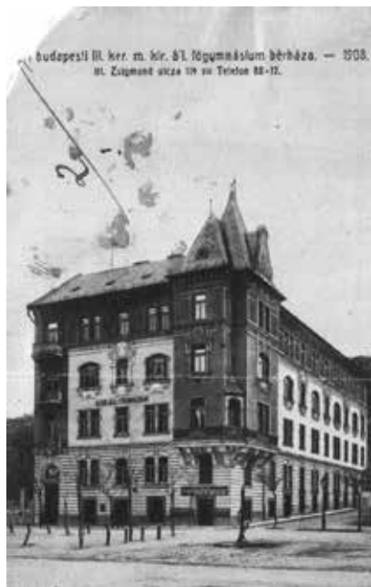
A Zsigmond téri épület 1908-ban

Természetesen a gyűjtés folyamatos. 40 album, 32 évkönyv, 9 iskolatörténeti munka, 38 iskolaújság, 56 oklevél, 95 különféle szöveg (pl. meghívók), 89 iskoláról szóló cikk, 244 tabló, tanári publikációk, fontos iskolai okmányok, az iskolaépülettel kapcsolatos dokumentációk, fontos fotók vannak a birtokunkban. Ezeket többnyire albumokba rendezve tároljuk. És mindezt számítógépre is vittem.