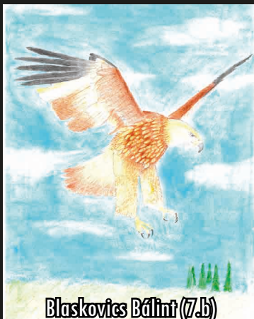
Blaskovics Bálint (7.b)