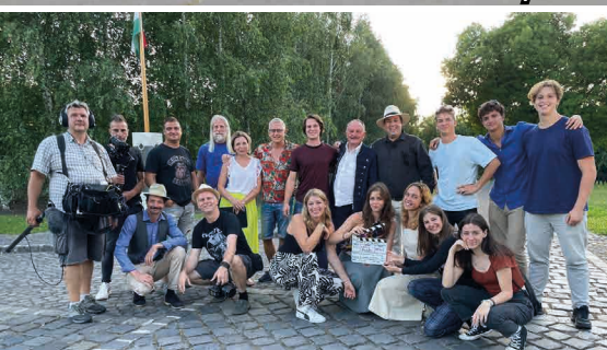
Tévés történelmi séta 1956 nyomában (17. oldal)