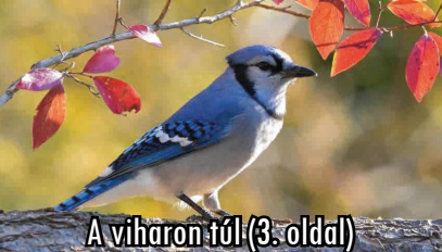
A viharon túl (3. oldal)