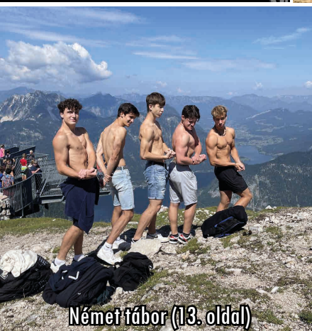
Német tábor (13. oldal)