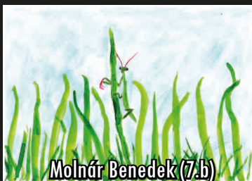
Molnár Benedek (7.b)