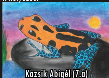
Kacsik Abigél (7.a)