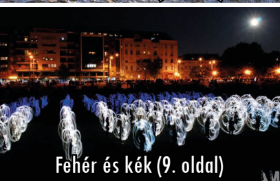
Fehér és kék (9. oldal)