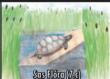
Sas Flóra (7.c)