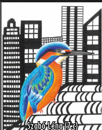
Szabó Léna (7.c)