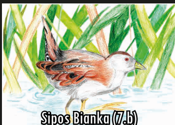
Sípos Bianka (7.b)