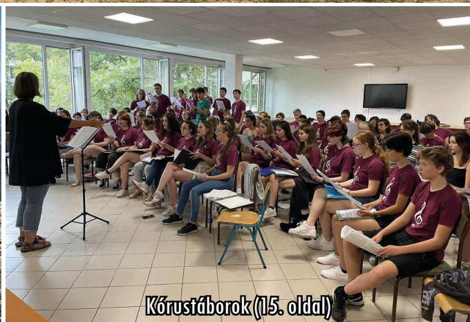
Kórustáborok (15. oldal)