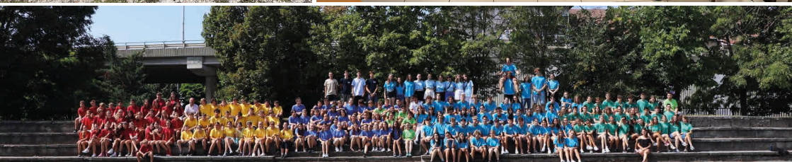
Gólyatábor (16. oldal)